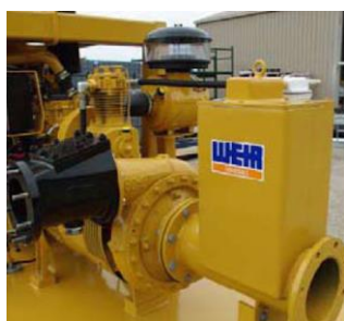
Odvodnění dolů MULTIFLO®