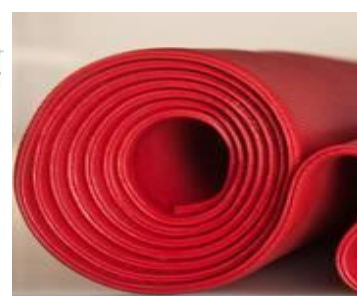
Gumové výrobky LINATEX®

Portfolio výrobků rozšiřujeme zdokonalováním existujících produktových řad, vývojem nových výrobků splňujících požadavky trhu a také novými akvizicemi doplňujícími naše stávající portfolio a posilujícími synergicky působícími efekty. Tímto způsobem byla firma WEIR Minerals rozšířena o firmu TRIO Engineering Products, specializovanou na výrobu drtičů a třídíčů.