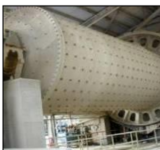
Abrazivzdorná vyložení VULCO®